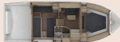
Cabin layout closed forward cabin Layout geschlossen