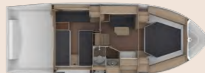
Cabin layout open forward cabin Layout offen