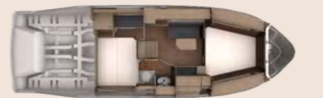
Cabin layout Kabinen-Layout