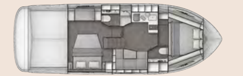
Cabin layout Kabinen-Layout