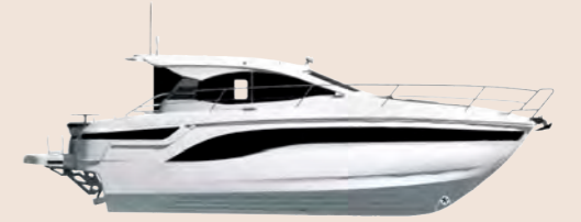
BAVARIA SR41 COUPE