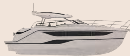
BAVARIA SR35 OPEN TOP

Das offene Design der BAVARIA SR35 OPEN TOP mit den heruntergezogenen Scheiben ermöglicht ein unvergleichliches Fahrerlebnis und lässt die Crew die Freiheit des Motorbootfahrens in vollen Zügen genießen. Das Hardtop-Dach wird zu einem festen Bimini mit Schiebedach. Oder einfach OPEN TOP, wie es das Designteam von BAVARIA YACHTS nennt. Wie bei allen SR-Line Modellen gilt die SR-Philosophie auch auf der BAVARIA SR35 OPEN TOP. Das Leben findet an Deck und im Cockpit statt.