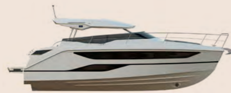
BAVARIA SR38 OPEN TOP

Gegenüber der klassischen Hardtop Version verfügt die BAVARIA SR38 OPEN TOP über eine flache, halbhöhe Windschutzscheibe. Das gesamte Cockpit ist damit nicht nur licht-, sondern auch luftdurchflutet und ein echtes Open-Feeling stellt sich ein. Das Hardtop spendet Schatten und bietet damit klare Vorteile und Schutz vor dem Wetter, im Hafen und auf dem Meer. Öffnet man das Schiebedach, verpasst man am Fahrstand keinen Sonnenstrahl und kann den puren Fahrtwind genießen.