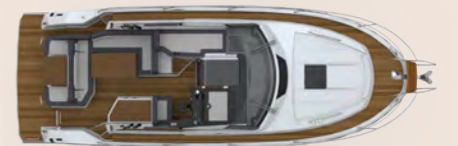
Deck layout Deck-Layout